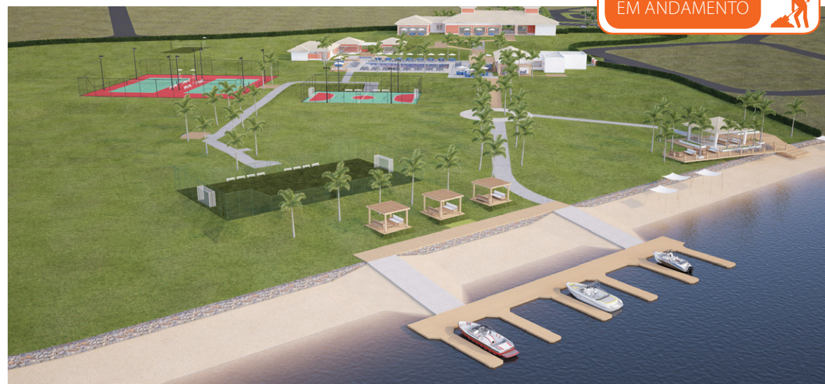
Perspectiva geral do Clube

As imagens acima estão sujeitas a alterações.