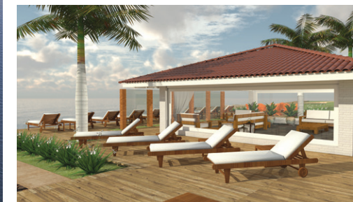
Área de estar