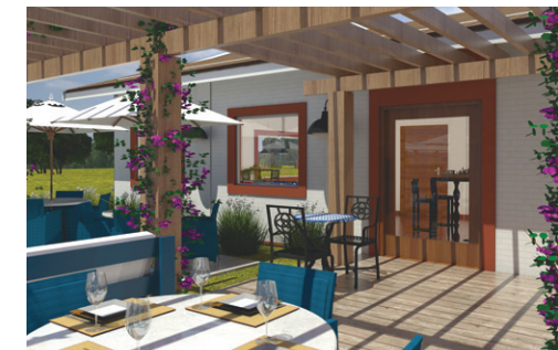
Restaurante - área externa

Quando concluídas todas as intervenções, você se encantará com o seu late Clube IV .